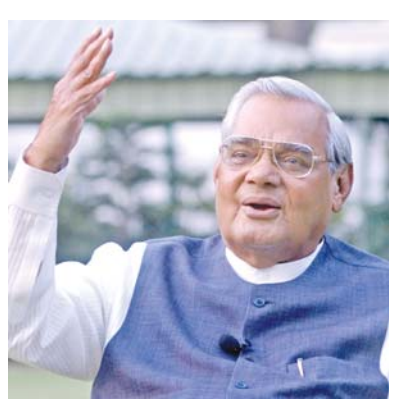
અટલજી ફૈઝના આશિક

પાકિસ્તાનમાં જનરલ ઝિયા-ઉલ-હકનું લશ્કરી શાસન હતું ત્યારે તેમણે ૧૯૮૫માં એક ફરમાન બહાર પાડીને સાડીને હિંદુ પોશાક ગણાવી એ પહેરવા પર પ્રતિબંધ લગાવ્યો હતો. એ વેળા પાકિસ્તાનની મશહૂર ગાયિકા ઈકબાલ બાનોએ કાળા રંગની સાડી પહેરીને લાહોરના અહમદ મરા ઓડિટોરિયમમાં ફૈઝની હમ દેબેંગે નજમ ગાવાનું પસંદ કર્યું હતું. ફૈઝની ૧૯૭૮ની આ રચના જ્યારે ઈકબાલ બાનોએ તાનાશાહ જનરલ ઝિયાના શાસનકાળમાં ગાવાનું પસંદ કર્યું ત્યારે ફૈઝની રચનાઓ - નજમો - ગઝલો પાકિસ્તાન ટીવી કે રેડિયો પર પ્રસારિત કરવા પર પ્રતિબંધ હતો ! ઈકબાલ બાનો સાથે ઉપસ્થિત સર્વજનો જનસમૂહ પણ ફૈઝની આ નજમ ગાતો હતો. એ ફૈઝ સાથે જ ઈકબાલ બાનોના નામે મશહૂર થઈ. એ નજમના શબ્દો કેઈક આવા હતા: હમ દેબેંગે લાજિમ હૈ કિ હમ ભી દેબેંગે વો દિન કિ જિસ કા વાદા હૈ જો લોહ-એ-અજલ મેં લિખ્યા હૈ જબ જુલય-એ-સિતમ કે કોહ-એ-ગિરાં સ્ઈ કી તરહ ઉડ જાએંગે ફૈઝ અહમદ ફૈઝની ૧૯૭૮માં અવતરેલી ઉપરોક્ત નજમનો સંબંધ ભારત અને પાકિસ્તાન બંનેની રાજકીય સ્થિતિ સાથે રહ્યો. ૧૯૭૭માં ભારતમાં ઉન્નિદરા ગાંધીની ઈમરજન્સી સમાપ્ત થઈ અને મોરારજી દેસાઈની સરકાર સ્થપાતાં લોકશાહી બહાલ