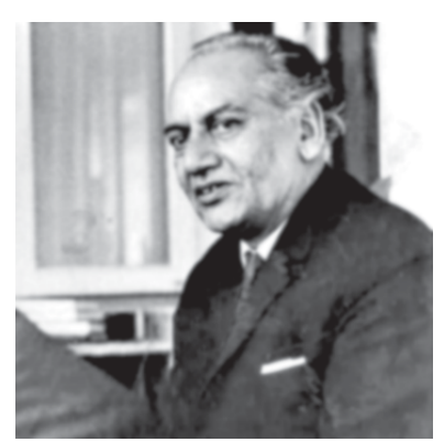
હિંદુ પોશાક અને ફૈઝ

પાકિસ્તાનમાં જનરલ ઝિયા-ઉલ-હકનું લશ્કરી શાસન હતું ત્યારે તેમણે ૧૯૮૫માં એક ફરમાન બહાર પાડીને સાડીને હિંદુ પોશાક ગણાવી એ પહેરવા પર પ્રતિબંધ લગાવ્યો હતો. એ વેળા પાકિસ્તાનની મશહૂર ગાયિકા ઈકબાલ બાનોએ કાળા રંગની સાડી પહેરીને લાહોરના અહમદ મરા ઓડિટોરિયમમાં ફૈઝની હમ દેબેંગે નજમ ગાવાનું પસંદ કર્યું હતું. ફૈઝની ૧૯૭૮ની આ રચના જ્યારે ઈકબાલ બાનોએ તાનાશાહ જનરલ ઝિયાના શાસનકાળમાં ગાવાનું પસંદ કર્યું ત્યારે ફૈઝની રચનાઓ - નજમો - ગઝલો પાકિસ્તાન ટીવી કે રેડિયો પર પ્રસારિત કરવા પર પ્રતિબંધ હતો ! ઈકબાલ બાનો સાથે ઉપસ્થિત સર્વજનો જનસમૂહ પણ ફૈઝની આ નજમ ગાતો હતો. એ ફૈઝ સાથે જ ઈકબાલ બાનોના નામે મશહૂર થઈ. એ નજમના શબ્દો કેઈક આવા હતા: હમ દેબેંગે લાજિમ હૈ કિ હમ ભી દેબેંગે વો દિન કિ જિસ કા વાદા હૈ જો લોહ-એ-અજલ મેં લિખ્યા હૈ જબ જુલય-એ-સિતમ કે કોહ-એ-ગિરાં સ્ઈ કી તરહ ઉડ જાએંગે ફૈઝ અહમદ ફૈઝની ૧૯૭૮માં અવતરેલી ઉપરોક્ત નજમનો સંબંધ ભારત અને પાકિસ્તાન બંનેની રાજકીય સ્થિતિ સાથે રહ્યો. ૧૯૭૭માં ભારતમાં ઉન્નિદરા ગાંધીની ઈમરજન્સી સમાપ્ત થઈ અને મોરારજી દેસાઈની સરકાર સ્થપાતાં લોકશાહી બહાલ