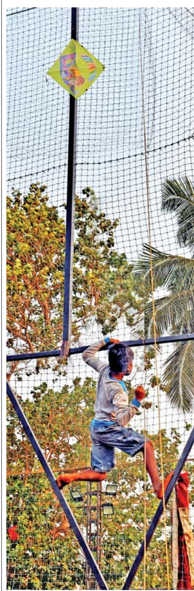
પતંગોત્સવ... ઉતરાયણ દરમિયાન ગિરગામ ખાતે એક ઇમારત પરથી રહેવાસીઓએ સાંજના સમયે પતંગ ઉડાવીને કરી હતી, જ્યારે મરીન ડ્રાઇવ ખાતે ખુલ્લા મેદાનમાં પણ લોકોએ પતંગ ચગાવીને ઉજવણી કરી હતી. અમુક બાળકોએ ફટકા પામ્યાં હતાં જ્યાં કરવામાં આનંદ માન્યો હતો. પાંજરાપોળ માધ્યમ બાળમાં ઘાયલ થયેલા પક્ષીઓને સારવાર આપવામાં આવી હતી.