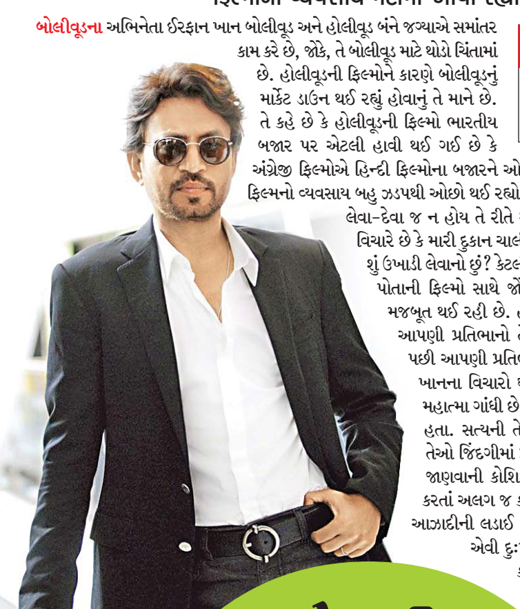
ફિલ્મી ખાતે અગસ્ત્ય શાહ feedback.matinee@ bombaysamachar.com

હોલીવૂડની ફિલ્મો હવે હિન્દી ફિલ્મોના માર્કેટ પર ઓવરલેપ થઈ રહી છે, આથી જ હિન્દી ફિલ્મોનો વ્યવસાય મંદીમાં આવી રહ્યો છે