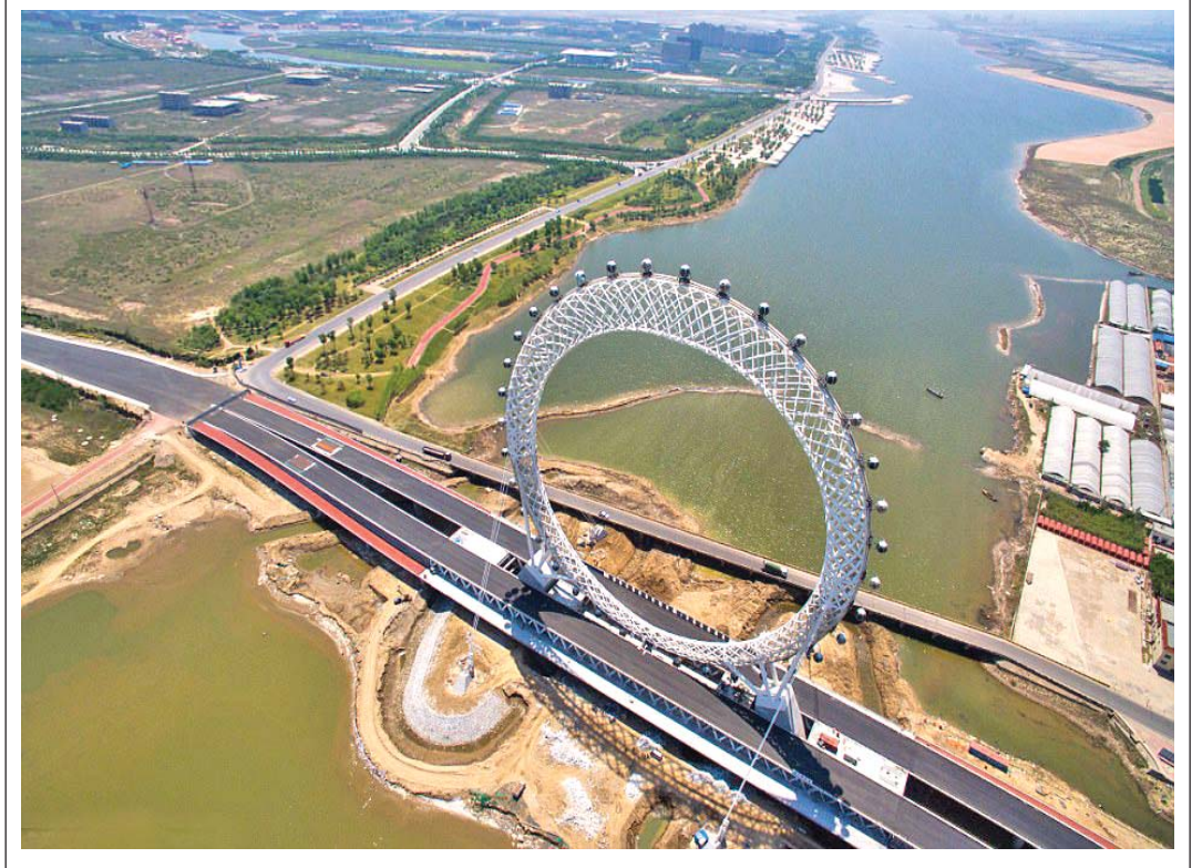
આમાં વાઈ-ફાય ને ટીવી પણ...