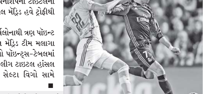
बुधवार मैड्रिडनी मेयमां जीजे गोल करी रहेलो रोनाल्डो.

मैड्रिड: पोर्टुगलना क्रिस्टियानो रोनाल्डोअे रियाल मैड्रिड टीमने बुधवार अर्ही सेल्टा विगो सामेनी मेयमां बे गोल करीने ला लिगा येंपियनशिपना टाइटलनी लगोलग लावी दीधी हुती. रियाल मैड्रिड हवे ट्रोफीथी अेक ज पॉइन्ट दूर छे. युरोपियन येंपियन टीम बासेलोनाथी त्रण पॉइन्ट आगण छे. हवे रविवार रियाल मैड्रिड टीम मलाग सामेनी मेयमां पराजय टाणशे तो पॉइन्ट्स-टेअलमां मोभरे थईने पांच वर्षमां पहेंलुं लीग टाइटल हांसल करशे. बुधवार रियाल मैड्रिड सेल्टा विगो सामे ४-१ थी विजय मेगव्यो हुतो.