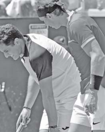
बुधवार रोममां पोताना ज देशना हरीइ जेलाडी अल्मैग्रोने वृंटाएमां एञ्ज शइ थतां तेनी पासे पहेंवी गथेलो राइल नडाल.

रोम: अेक समयनो वर्ल्ड नंबर वन अने त्रण वपत केंन्य ओपन जलनार स्पेननो राइल नडाल बुधवार रोम मास्टर्स टुर्नामिन्टना त्रीञ्ज राउन्डमां पहेंवी गथो हुतो. तेना ज द शना निकोलस अल्मैग्रोने नडाल सामेनी मेयमां मांड २४ मिनिट थई हुती त्प्यां उभा वृंटाएमां एञ्ज शइ थई हुती जेने कारणे तेणे मेयमां रमवानुं छोरी दीधुं हुंतु अने अे समय उ- ० थी आगण रहेला नडालने विजेता ज़ाहेर करायो हुतो. नडालनो रोममां आ पठमो विजय हुतो. अल्मैग्रो आ पहेंलां नडाल सामेना त्रण्ये मुकाबला हारी गथो हुतो. केंन्य ओपनना गणतरीना दिवसो पहेंलां ज नडाल सारो आत्मविश्वास मेगवी रब्बो छे. ■