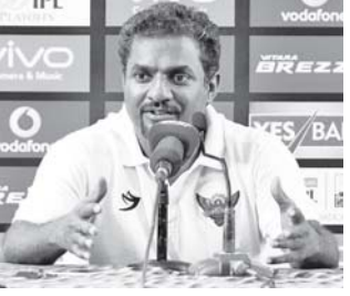
होत. आ वर्षे अर्ही ओ.म. चिन्नास्वामीनी पिय लो-स्कोरिंग रही छे जेना पर अमे १२२ रननो अमारा स्कोरने डिडेन्ड करी शक्या होत. जोके, नॉकआउटमां आचो आंचकी आवे पाए भरो. कमनीबे, आ वर्ष अमारी तरडेइपामां नहोतुं. ■

बेंगलुरु: बुधवार अर्ही सनराइडर्स हैदराबाद बॉटिंग मग्या बाद २० ओवरमां ७ विकेटे १२२ रन बनाव्या बाद वरसाएना अवरोधने कारणे कोलकाताने मधरात बाद छेवटे मात्र ६ ओवरमां ४८ रननो लक्ष्यांक मग्यो हुतो जे ओणे सात विकेट अने थार बॉल बाकी रापीने मेगवी लीधो हुतो. डिडेन्डिंग येंपियन हैदराबादना केंय सुधैया मुरलीधरने मेय पछी कहुं हुंतु के 'जे वरसाएनुं विद्वन न आच्युं हुंतु तो अमे ज आ अेलिमिनेटर ज़ुतीने मुंभई छन्डियन्स सामेनी शुक्रवारनी बीछ क्वालिफायरमां पहेंवी गथा